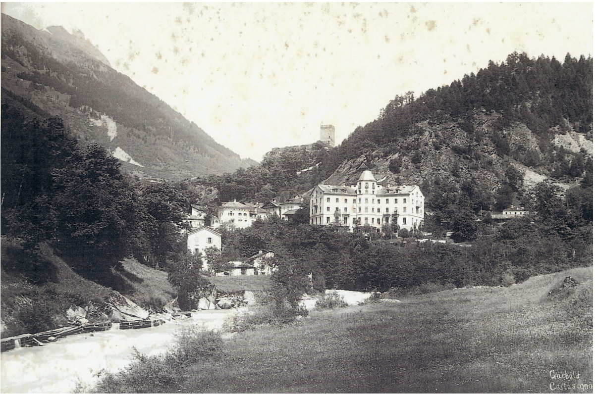
oben: Raststätte Hotel Bregaglia in Promontogno im Bergell, 19. bis Mitte 20. Jh. unten: Beispiel einer Rast- und Aussenstation in der Arktis, Mitte 19. Jh. rechts: <Zeichen und Erosion>, Schieferplatz Klinik Beverin im Domleschg, 2002