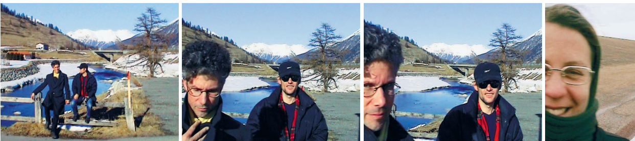
Live-Kamerabild bei S-chanf (zwei Personen auf der Strasse), Videoeinspielung von Aufnahmen mit inszenierten Spielhandlungen, Begegnungen, soziale Situationen vor landschaftlichem Hintergrund