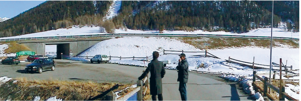
Kamera und Monitor werden in einer Stele aus Edelstahl untergebracht. Stromanschluss an der Strassenlaterne, Online-Anschluss über Funk