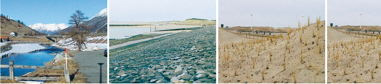
Live-Kamerabild bei S-chanf (kein deutliches Geschehen im Sichtfeld der Kamera), Videoeinspielung von Landschaftsaufnahmen am Rande des Deltaprojekts, der grössten Damm- und Sturmflutanlage der Niederlande